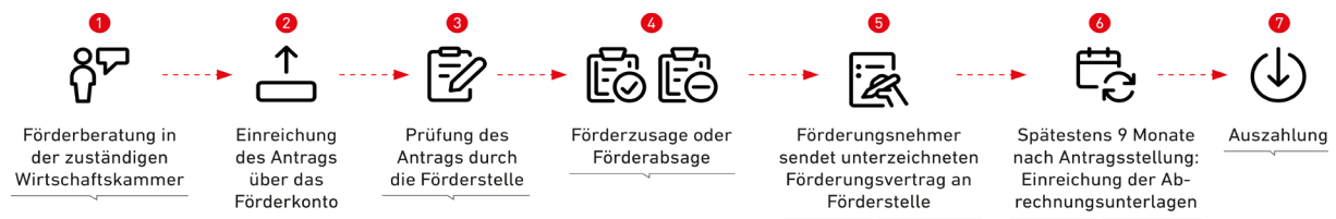
Abb: Prozess Abwicklung Antrag

Das Bundesministerium für Digitalisierung und Wirtschaftsstandort (BMDW) als Fördergeber hat die Wirtschaftskammer Österreich (WKÖ) und ihre Abteilung AUSSENWIRTSCHAFT AUSTRIA mit der Abwicklung dieser Förderung betraut.