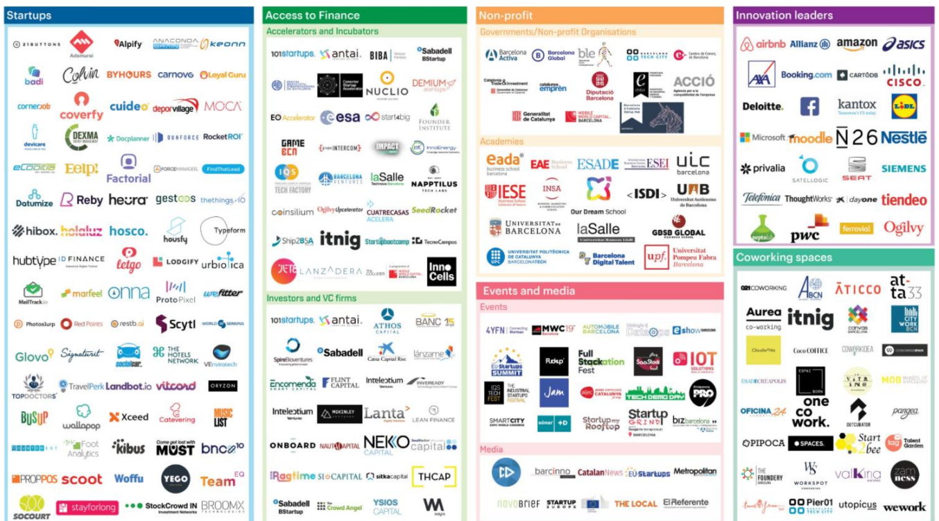
Abbildung 3: Weiterführende Investitionsmöglichkeiten (Überblick) 14