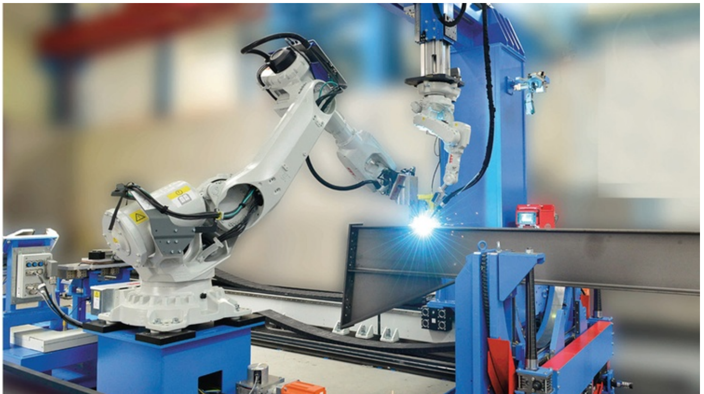
Steel Beam Assembler