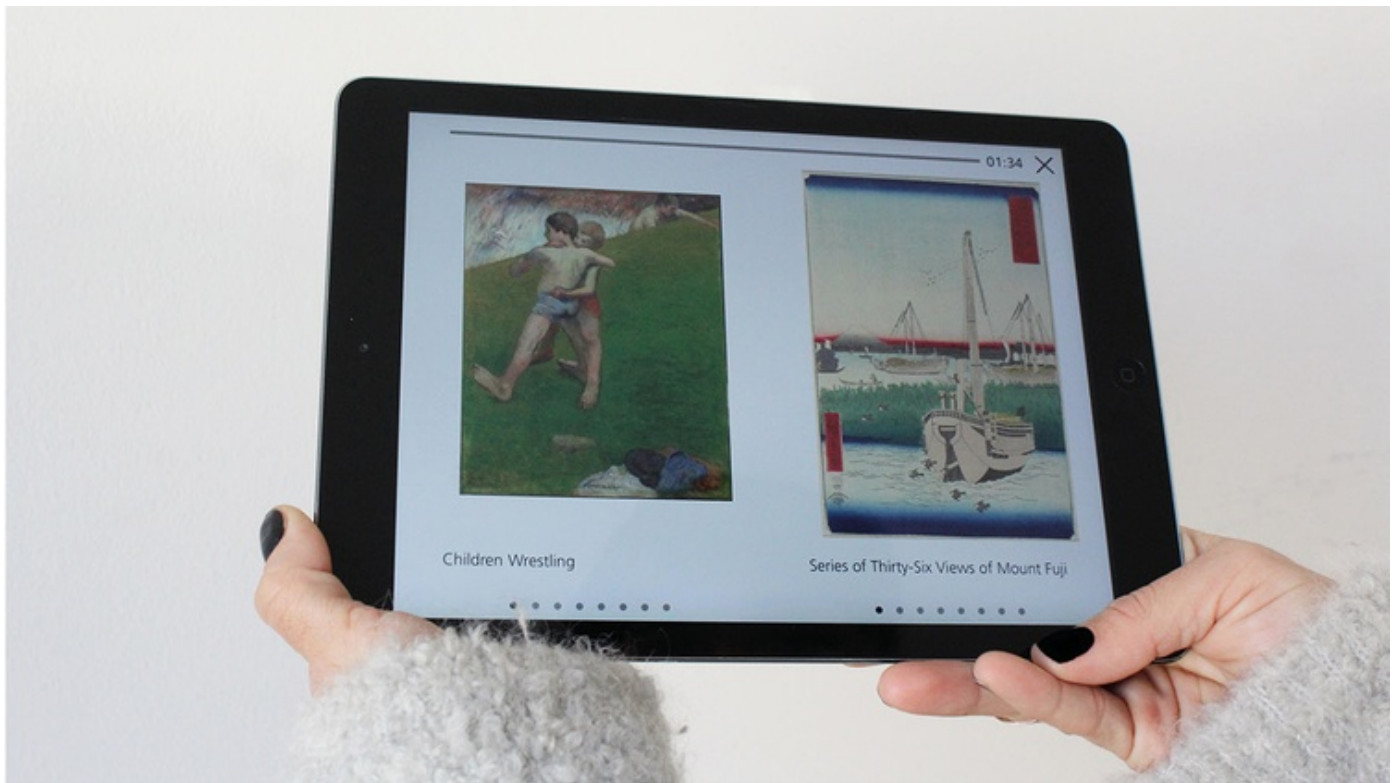
Children Wrestling, Paul Gauguin