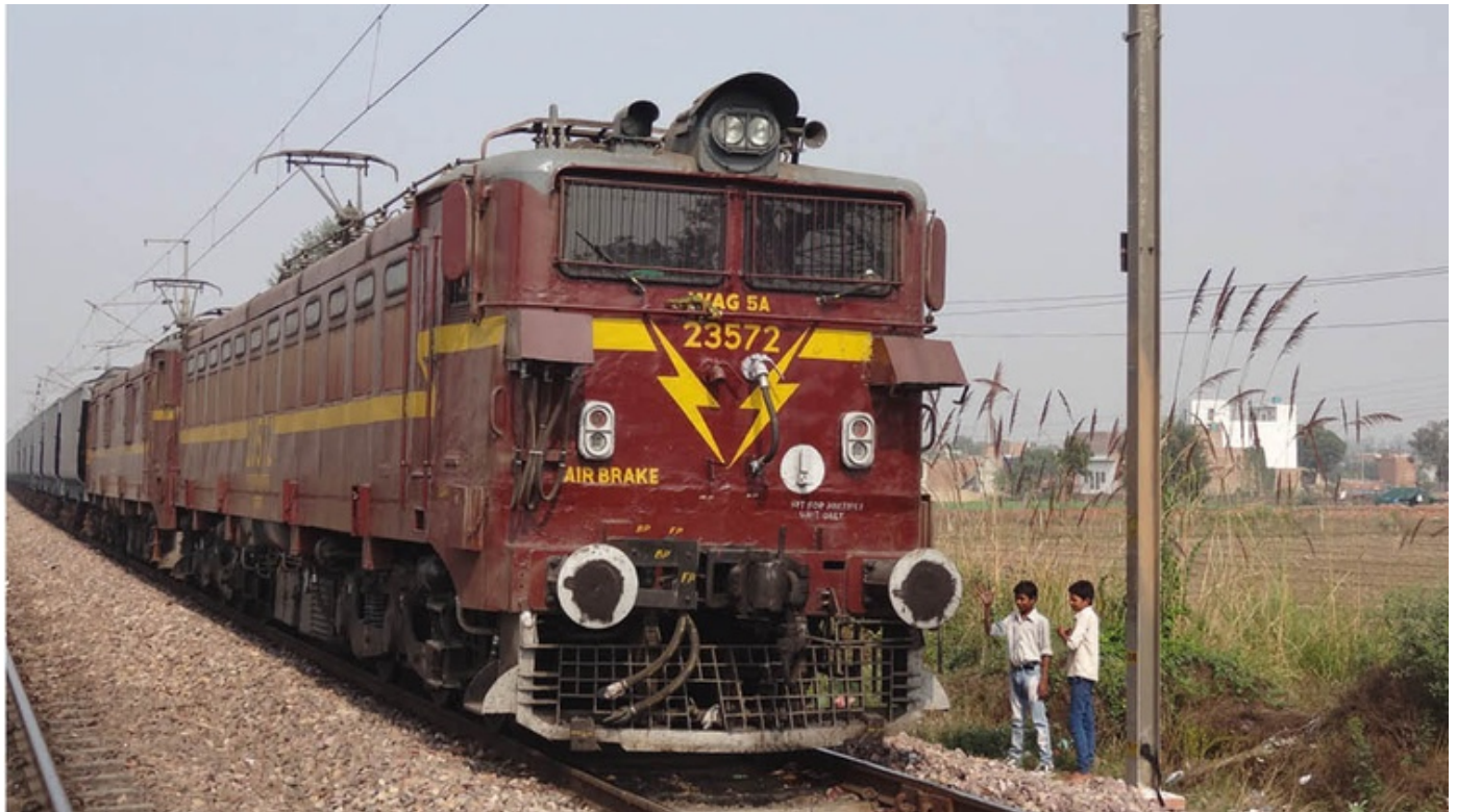
Induktive Radsensoren von Frauscher detektieren Züge selbst unter schwierigsten Bedingungen höchst zuverlässig.