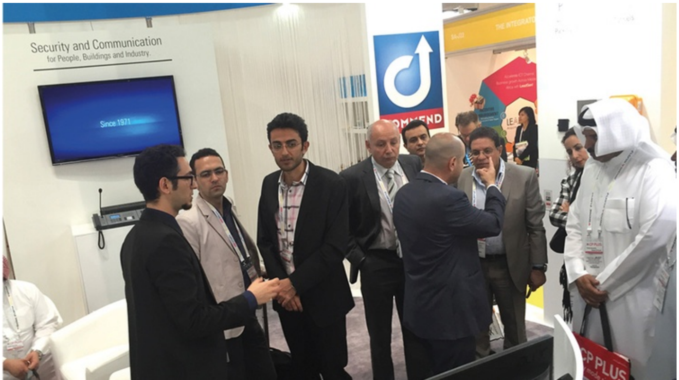
Messeauftritt "Intersec" in Dubai