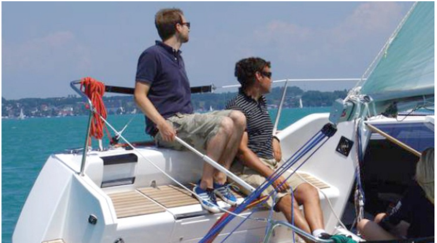
Der Bootsmotor im Einsatz