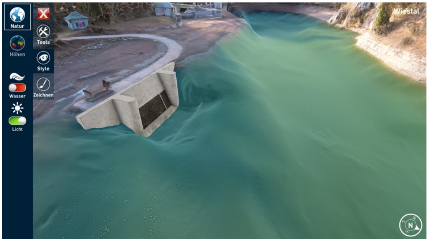
3D Modell der Kraftwerksanlage eines großen Energiekonzerns.