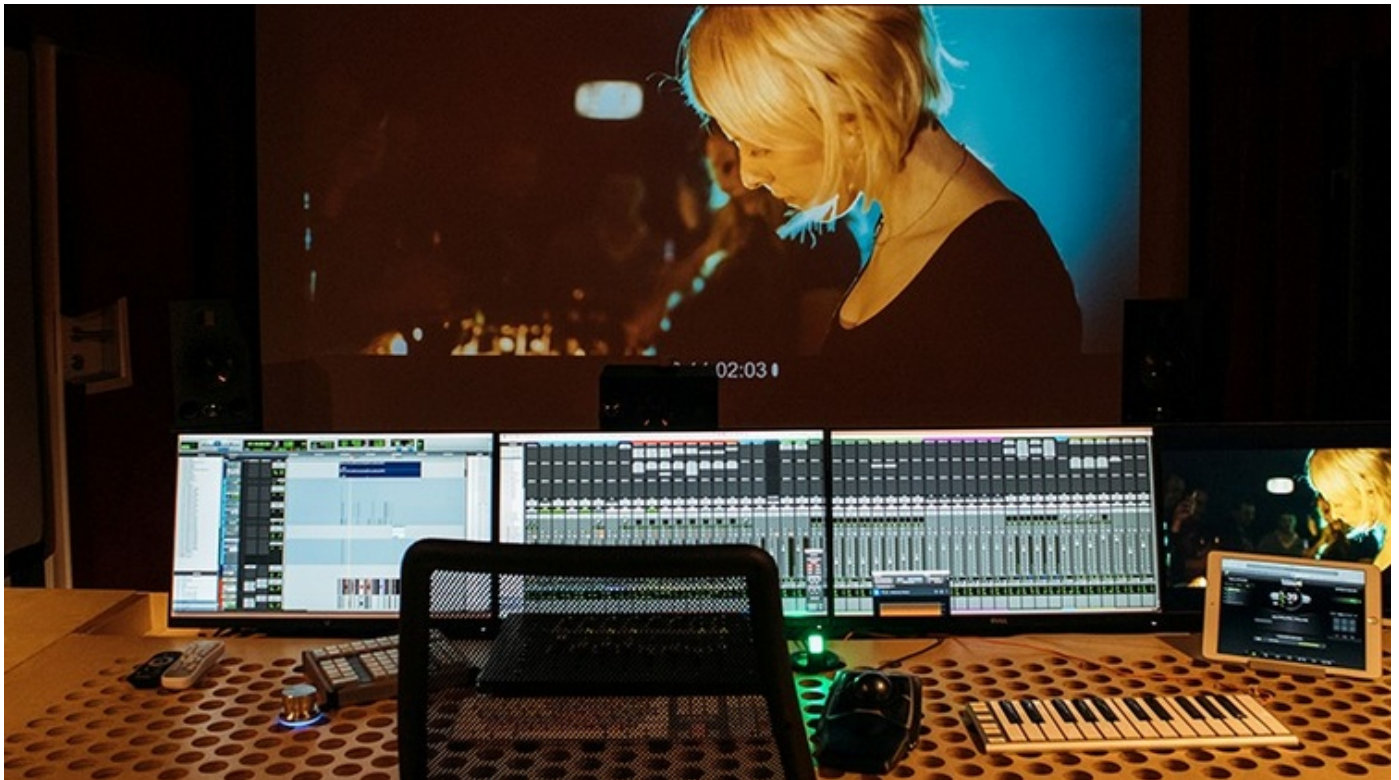
Tonstudio - Sounddesign - Musikproduktion