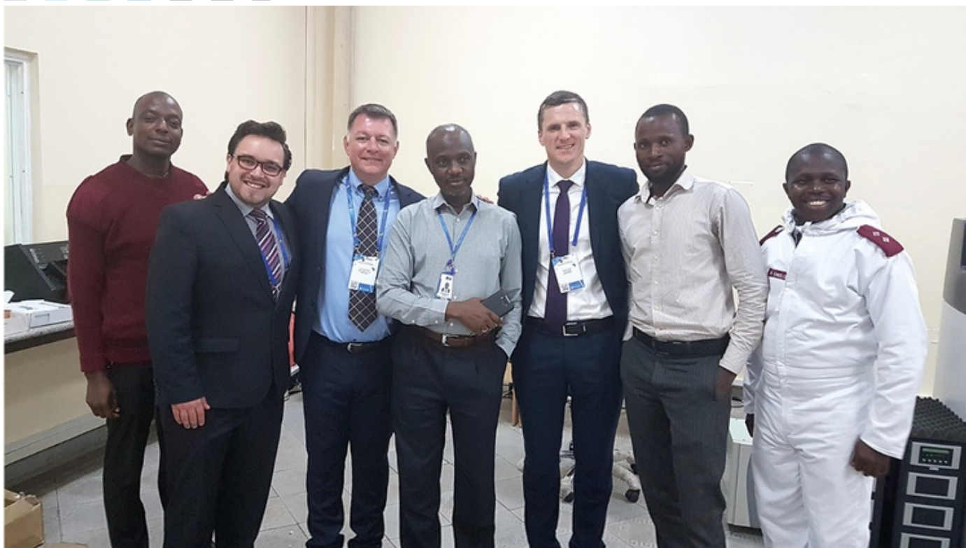
Die Partnersuche im Kongo war erfolgreich