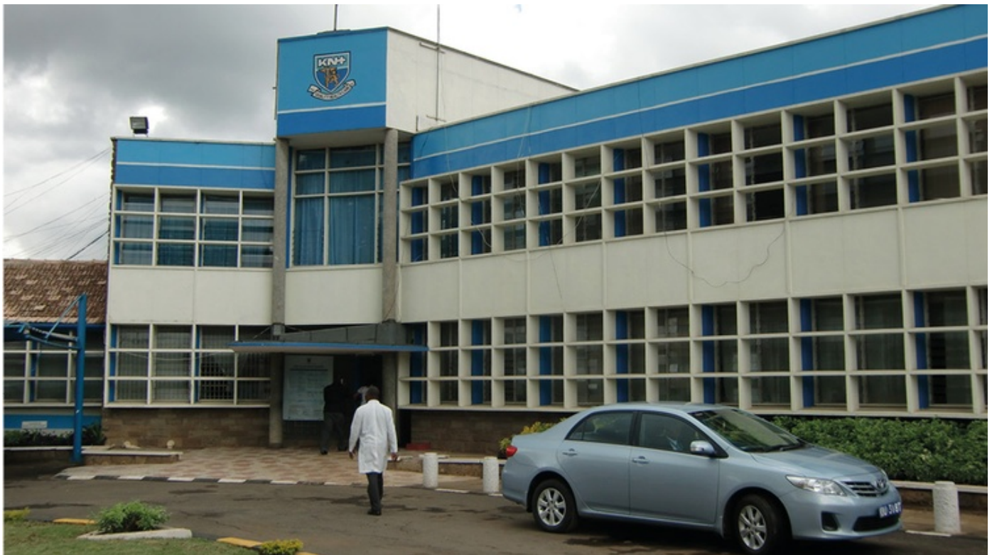
Kenyatta National Hospital